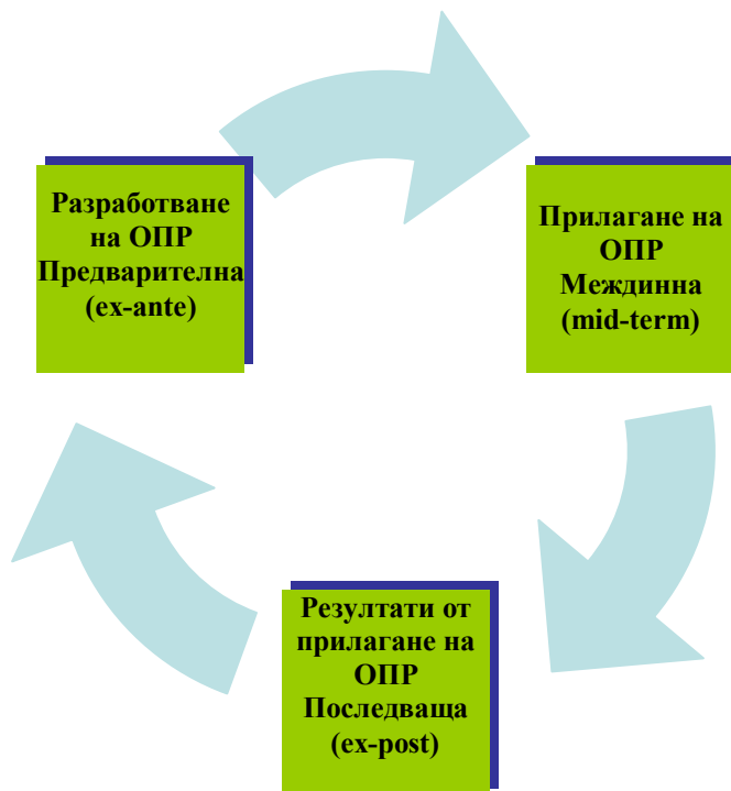
Графика № 1: Връзка между основните фази на ОПР с видовете оценки.

Този документ е създаден с финансовата подкрепа на Оперативна програма „Административен капацитет“, съфинансирана от Европейския съюз чрез Европейския социален фонд. Цялата отговорност за съдържанието на документа се носи от община Чавдар и при никакви обстоятелства не може да се приема, че този документ отразява официалното становище на Европейския съюз и Управляващия орган